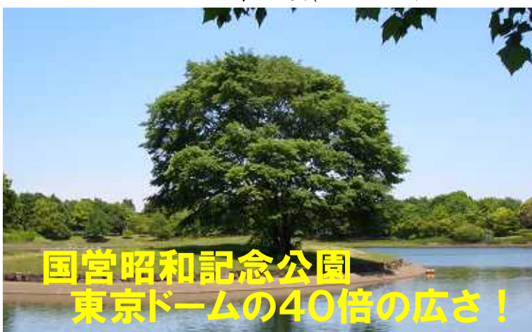
国営昭和記念公園 東京ドームの40倍の広さ!